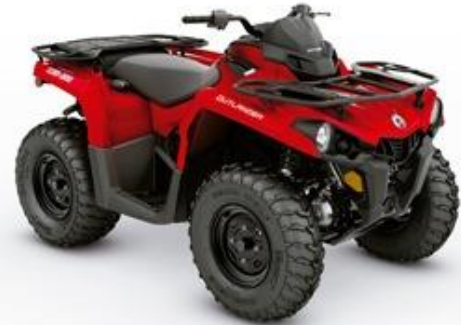
Viper Red / 450 / 570