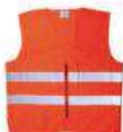
Chaleco ligero de 2 bandas