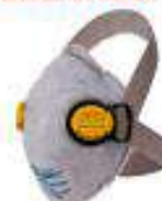
Mascarilla para VO con doble válvula