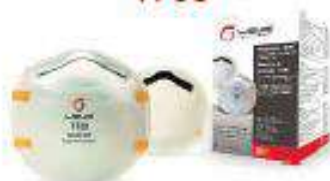
Mascarilla para polvo N95