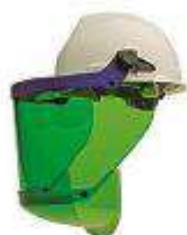
Careta de pantalla verde y pantalla transparente para portecccion contra el arco eléctrico