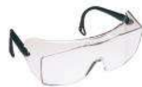
Lente sobre montura con luna clara modelo OX 1000 12165