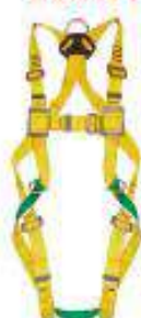
Arnes integral de 3 anillas y 5 hebillas