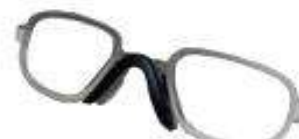
Inserto claro para anteojos aurora 2320