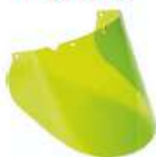
Visor verde moldeado arco eléctrico