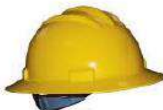
Casco tipo minero