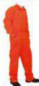
Mameluco cocido en tela drill