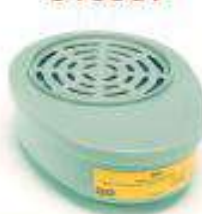
Cartucho para partículas VO y GA