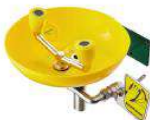
Lava ojos y rostro