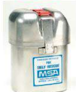
Autorescatador self rescuer W65