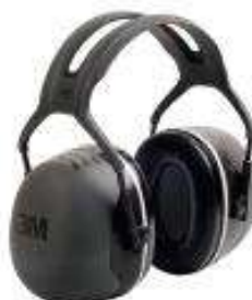
Orejera tipo copa