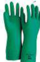
Guantes solvex nitrilo de 13"