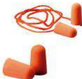
1100 sin cordón 1110 con cordón Tapones auditivos descartables de 29 dB