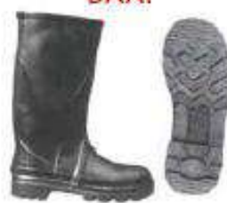
Bota de jebe acerada antideslizante F/ termico