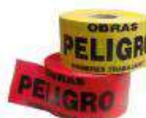
Cintas señalizadoras amarilla- rojo "PELIGRO HOMBRES TRABAJANDO"