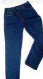
Pantalon denin 14 onzas