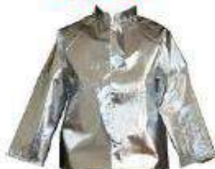
Saco con forro neru