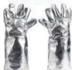
Guante con forro neru