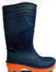
Nitro- dieléctrica puntera de composite