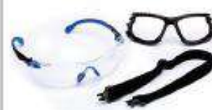
Solu Kit luna clara con antiempañante