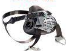
Respirador media cara