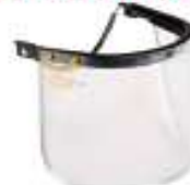
Visor de esmerilar