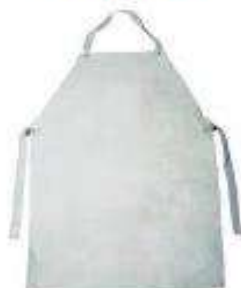
Mandil cuero cromo