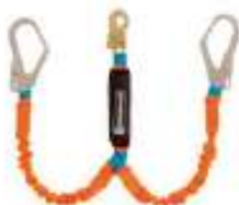
Línea de vida doble corrugada