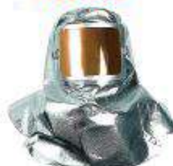
Capucha con visor dorado