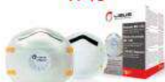
Mascarilla para polvo N95 con válvula de exhalación.