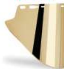
Visor elvex dorado FS-18GL