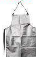
Mandil rayon aluminizado