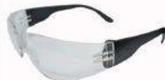
Anteojo ecoline transparente AF