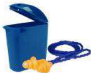
1270 sin cajita 1271 con cajita Tapones auditivos reusables de 24 dB