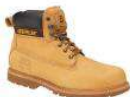
Holton ST-Honey reset