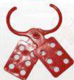
Pinza metalica Lock out