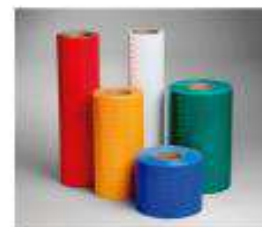
Grado diamante cubo DG3