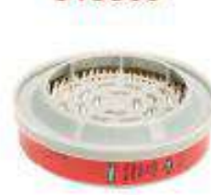
Cartucho P100 para partículas VO y GA