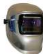
Careta soldadura fotosensible Element