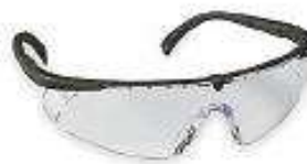
Luna clara virtua V8