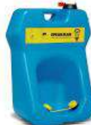
Estación de lava ojos portátil de alta capacidad