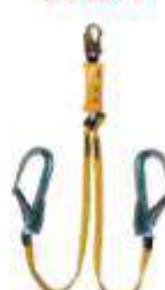
Línea de conexión doble con amortiguador