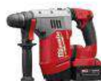
Rotamartillo electrico a bateria