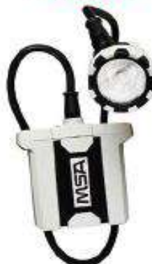
Lámpara minera luminator