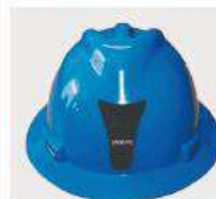
Casco minero c/ PTL-PTC