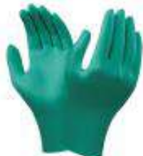
Guantes touch tuff quirúrgicos nitrilo