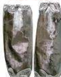
Mangas con forro neru