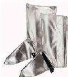
Escarpin con forro neru