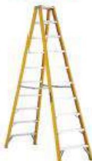
Tijera doble acceso