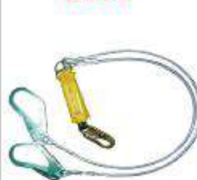
Línea de conexión doble acerada