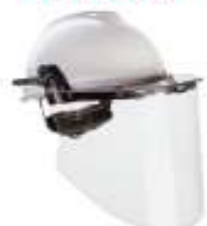
Visor claro moldeado