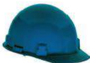
Casco tipo jockey altas temperaturas