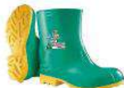
Botin de PVC especial para quimicos- materiales peligrosos