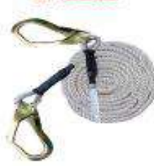
Línea vertical en cabo 5/8"