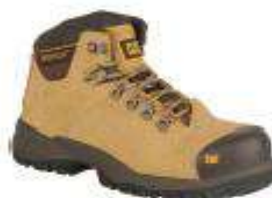
Coolan ST-Honey reset