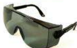
Sobrelentes para anteojos de seguridad luna oscura