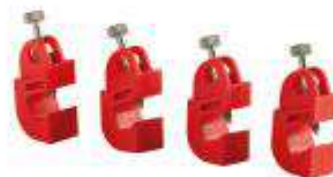
Kit bloqueo breaker electrico