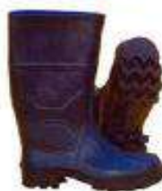
Bota de jebe alta c/ punta de acero