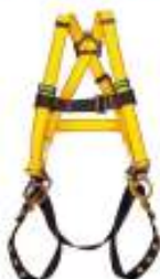
Arnes Workman de 3 anillos con enganche QWIK FIT