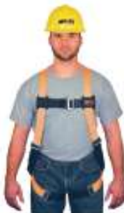
Arnes 3 argollas