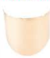
Visor V-GARD PC volteado