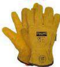
Guante de cuero carmaza