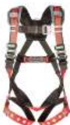
Arnes de 3 anillos EVOTECH