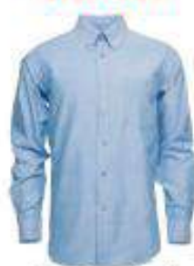
Camisa oxford manga larga