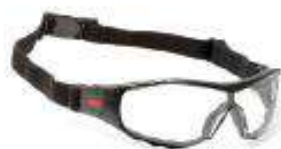
Lente virtua block plus