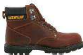
Second Shift ST