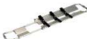
Camilla separadora de aluminio