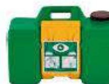
Lavajojos Portatil HAWES AVLIS