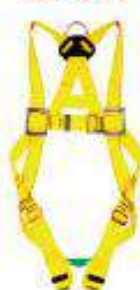
Arnes integral de 3 anillas y 3 hebillas