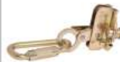
Freno para soga