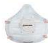
Sperian con Válvula