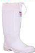
Bota PVC acolchada para frio