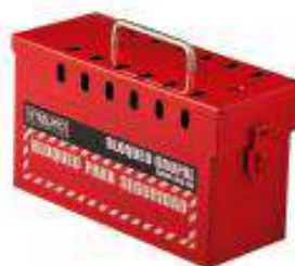
Cajas de bloqueo