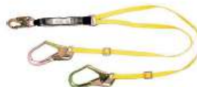
Línea de vida doble Workman con gancho grandes y amortiguador de impacto