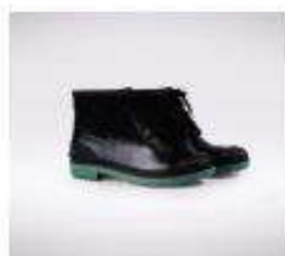
Botin de PVC con y sin punta de acero