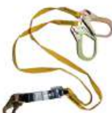
Línea de vida doble