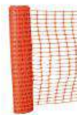
Rollo Malla faena 50YDS x 1mt 80-60 gramos