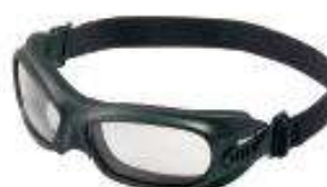
Wildcat V80 Jackson