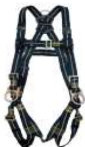
Arnes 3 argollas soldador