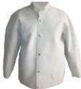
Casaca cuero cromo