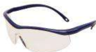
Anteojo MIG transparente AF