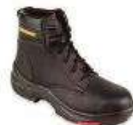
Botin aislante electrico 20 KV