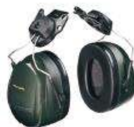
Orejera para adaptar al casco