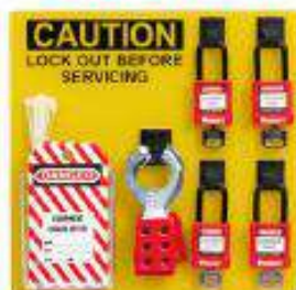
Tablero con 4 candados