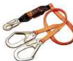
Línea de vida doble