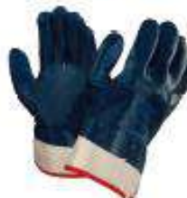
Guantes hycon recubierto de nitrilo 11"