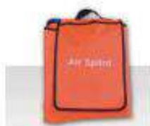
Ferulas neumaticas inflables