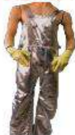
Pantalon overall con forro neru