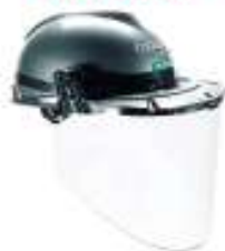
Visor claro contorneado