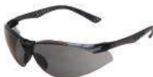
Anteojo Neon gris AF