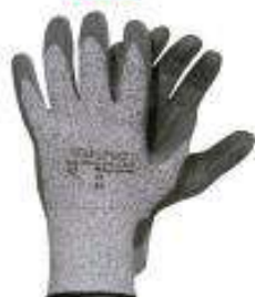
Multiflex CUT-5 PU