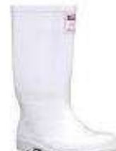
Bota de seguridad PVC