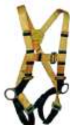
Arnes 3 argollas estandar