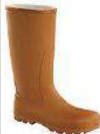
Botas aislantes electricas 10 Kv y 20 Kv