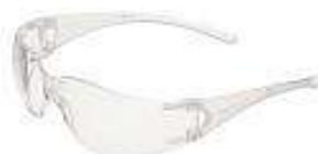
V10 Lentes Element