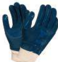
Guantes hycon recubierto de nitrilo