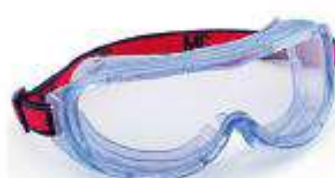
Goggles 122 vision amplia con anti-empañante