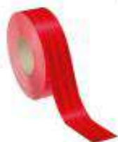
Cinta reflectivas para marcaje vehicular