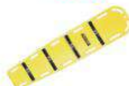
Tablero de plástico