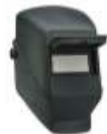
W10 Visor Alzable