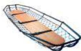
Camilla de rescate