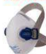
Mascarilla para polvo N95 con doble válvula