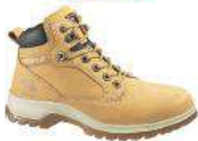
Kitson SRX-Honey Reset