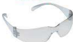
Anteojos de seguridad Eco light luna clara