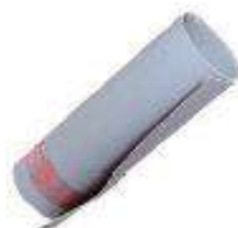
Alfombra aislante clase 2