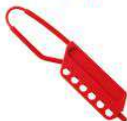
Pinza diélectrica Lock Out