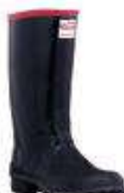
Bota de caucho forro azul