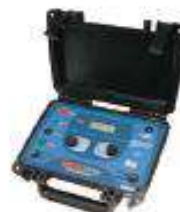
Telurómetro digital 20 KOHMS