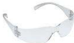
Luna clara Virtua