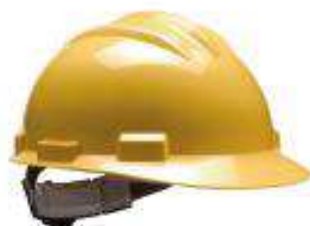
Casco tipo Jockey