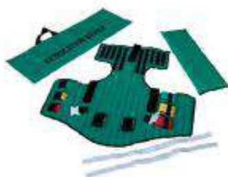
Chaleco de extricación