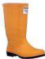
Bota de PVC resistant calidad acero