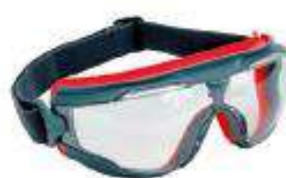
Goggle gear 500