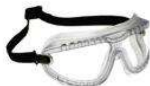
Gafa Splash luna clara modelo Gogglear