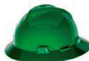
Casco tipo sombrero