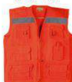
Chaleco drill tipo reportero