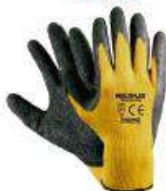
Multiflex Original Látex