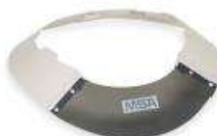
Protector solar para casco jockey