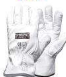
Guante de cuero puño corto