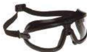
Lente luna clara antiempañante, antirayadura con marco negro de nylon.