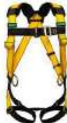
Arnes Workman de 4 anillos con enganche QWIK FIT