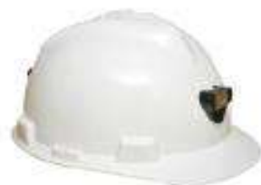
Casco tipo jockey con portalampara