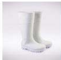
Botas de PVC con y sin punta de acero