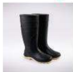
Botas de PVC con y sin punta de acero