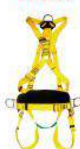
Arnes con apoyo lumbar