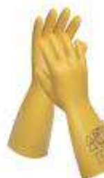
Guantes dielectricos, sobre guantes, verificadores de guantes