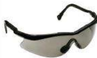
Lentes QX 2000