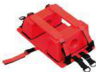
Inmovilizador de cabeza