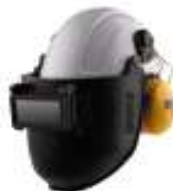
Visor soldador adaptado al casco