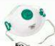
M920V con Válvula