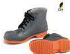
Botin de PVC- nitrilo resistente a quimicos y abracion