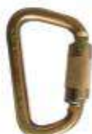
Mosquetón de acero zincado