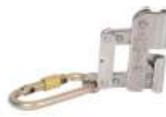
Freno para cable