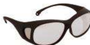
V50 tipo escudo OTG