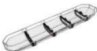
Camilla para espacios reducidos