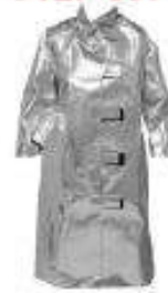
Abrigo con forro neru