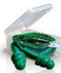
1241 Tapón auditivo con cajita