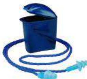
1290 sin cajita 1291 con cajita Tapones auditivos reusables de 25 dB