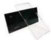
Luna para soldador