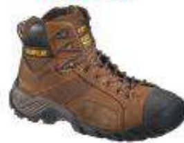
Argon HI-Dark Brown