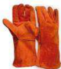
Guante soldador naranja