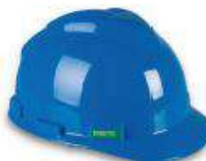
Casco tipo Jockey