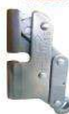
Freno para cable pulido