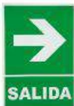
Diseños de acuerdo a la NTP 399.010