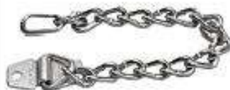
Cadena de acero de 229 mm de largo