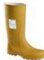
Bota de caucho natural aislamiento eléctrico