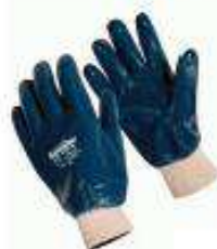
Nitrilo Resistor Smooth puño tejido