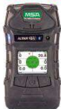
Detector de gas con VOC