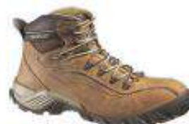
Nitrogen CT- Dark Beige