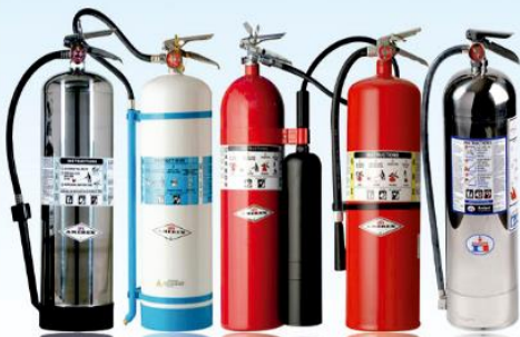
ACETATO DE POTASIO 2.5 GLS. AGUA DESMINERALIZADA 2.5 GLS. CO2 15 LBS. PQS UL 20 LBS. H2O 2.5 GLS.