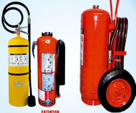
EXTINTOR CLASE D EXTINTOR BOTELLA EXTERNA EXTINTOR RODANTE 50 KG.