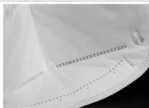
Cómoda tela no tejida